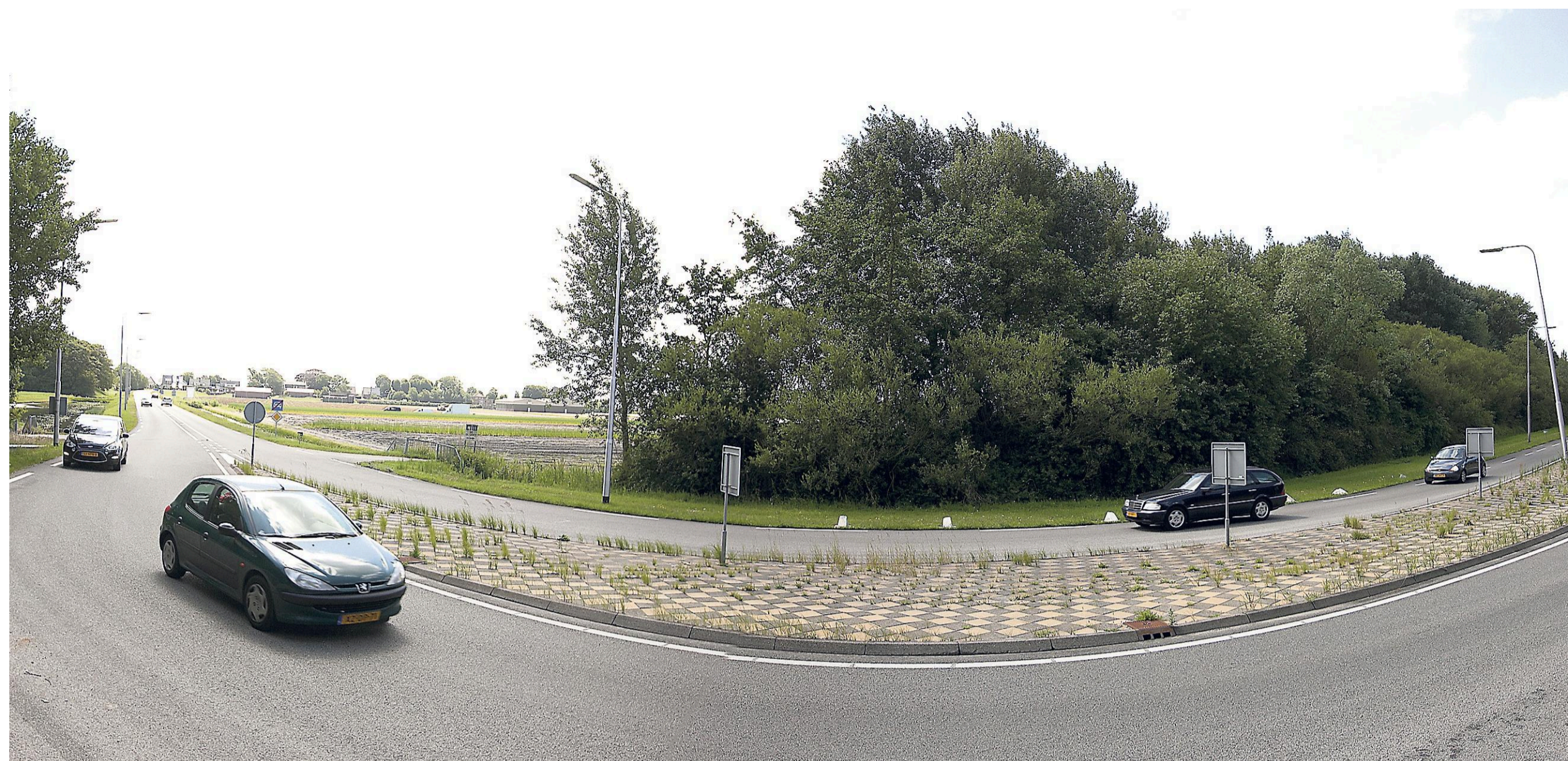
Het einde van de N206 tussen De Zilk en Vogelenzang.

De provincie Noord-Holland onderschrijft de uitkomsten van het door de provincie zelf gebruikte model niet. Het wordt het wel drukker op de N206, laat een woordvoerder weten, „maar dat hoeft niet tot problemen te leiden. De provincie kan een grote hoeveelheid verkeer aan omdat hij geen