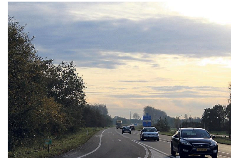
Provinciale weg N206 bij Noordwijkert hout

Maar om politiek redenen kentert kort na de eeuwwisseling het tij een beetje. Om Holland Rijnland echt van de grond te krijgen wordt onder meer een investeringsfonds opgericht. Na veel plussen en minnen besluiten de gemeenten daar gezamenlijk 140